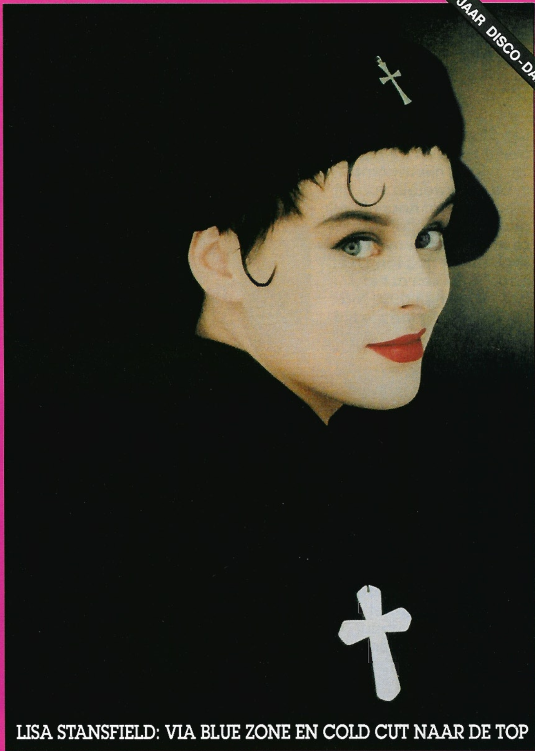
LISA STANSFIELD: VIA BLUE ZONE EN COLD CUT NAAR DE TOP