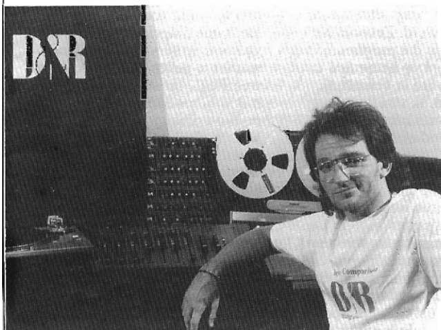
De Discom2 kost slechts Hfl 1395,00.

De Discom2 is een bijzondere discotheekmixer, een "werkbank" zoals Jeroen zijn Discom noemt. Snel, betrouwbaar en alle mogelijkheden om je ook op weg te helpen naar succes.